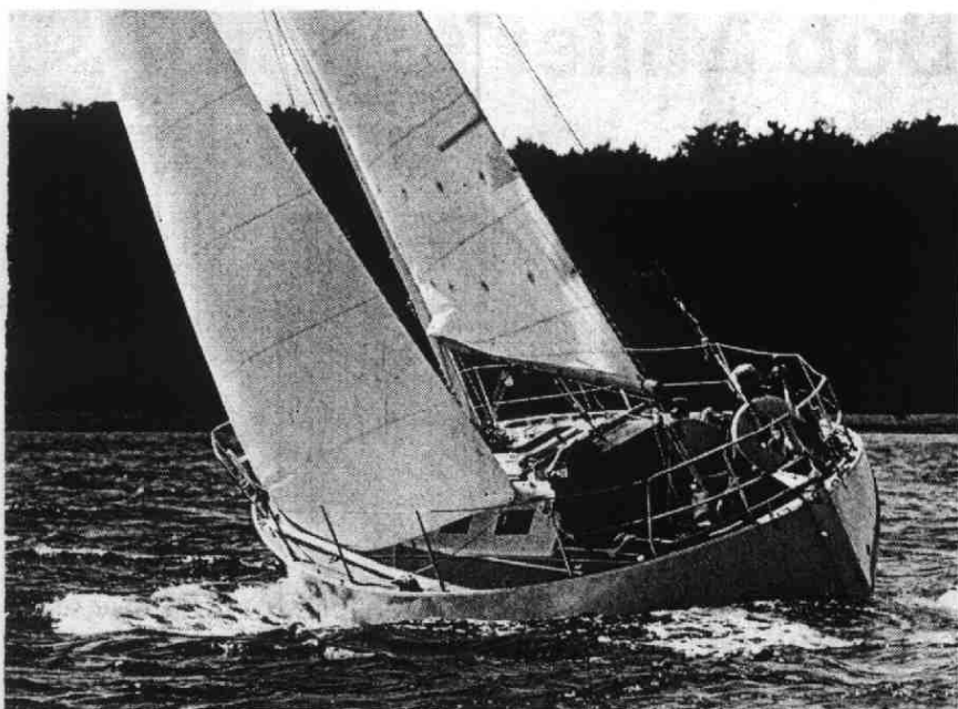
Grinde på kryds.